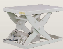
電動ネジ駆動タイプ