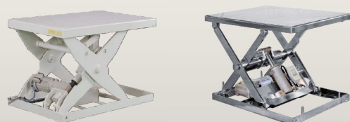
電動ネジ駆動タイプ