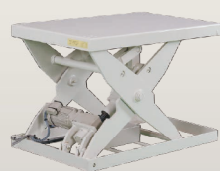
電動ネジ駆動タイプ