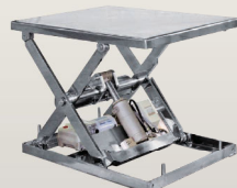
ステンレスタイプ