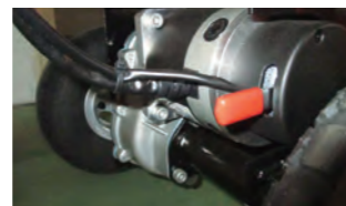
ブレーキ解除レバー