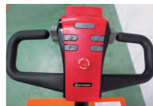
簡易でわかり易い操作ハンドル