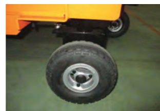
ノーパンクタイヤ