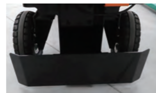
フットガード (オプション)