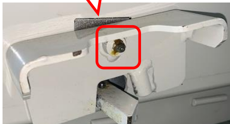
グリスニップル部